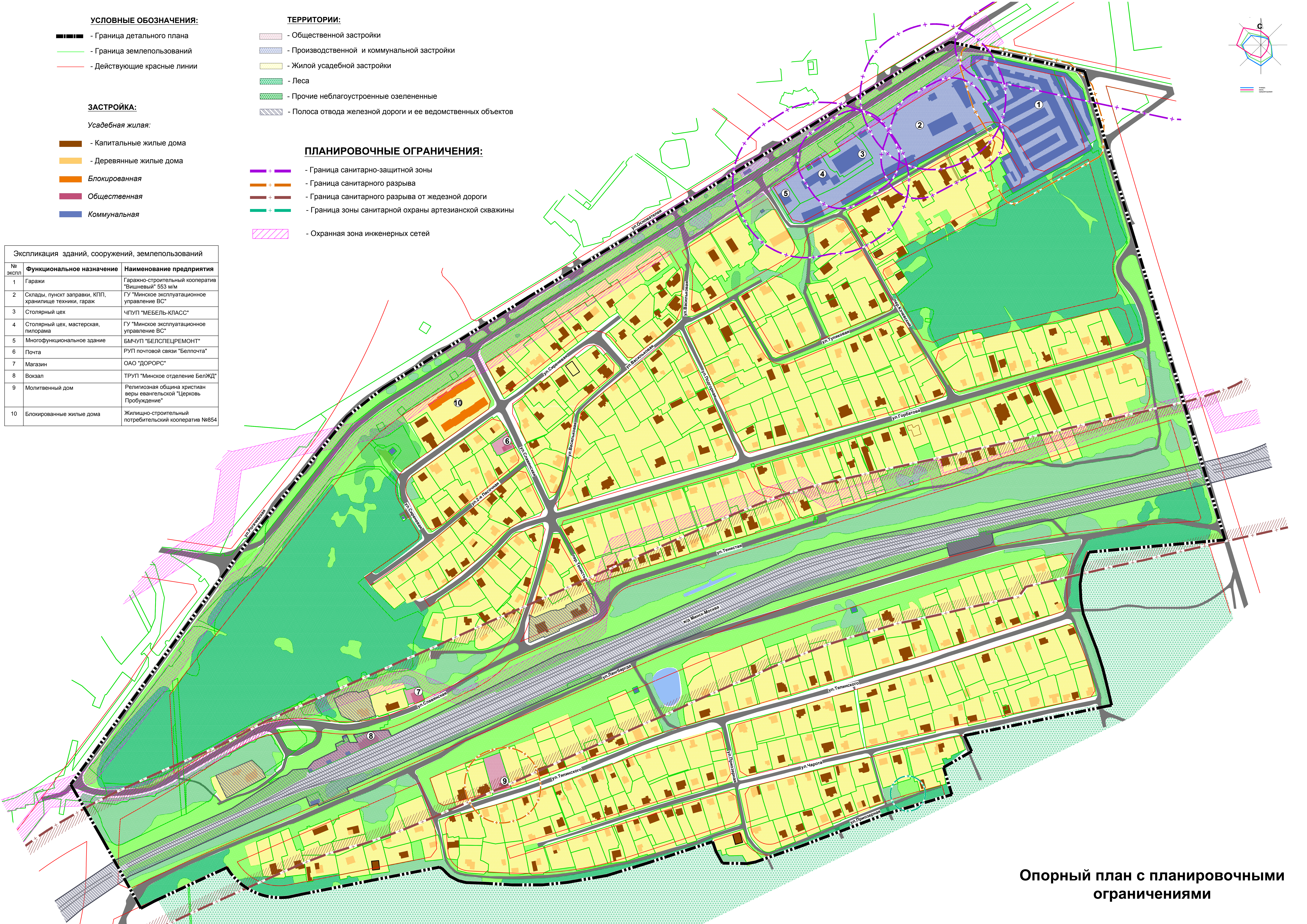
Опорный план с планировочными ограничениями